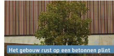
Het gebouw rust op een betonnen plint