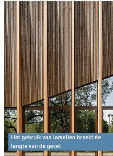
Het gebruik van lamellen breekt de lengte van de gevel