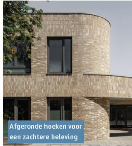
Afgeronde hoeken voor een zachtere beleving