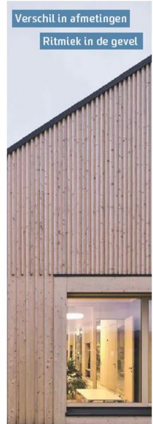
Verskil in afmetingen