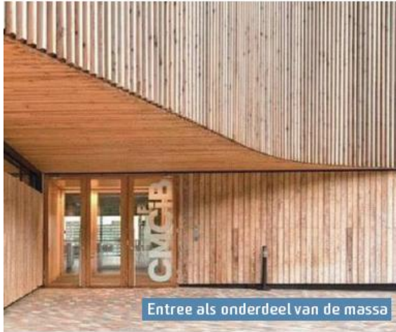
Entree als onderdeel van de massa